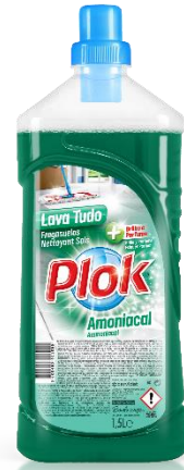
IMAGEM DE PRODUTO